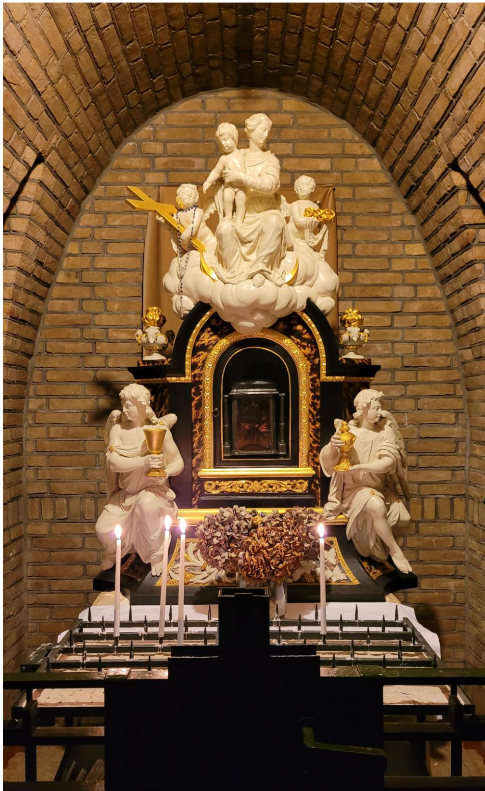
Mariahoek (meimaand Mariamaand)