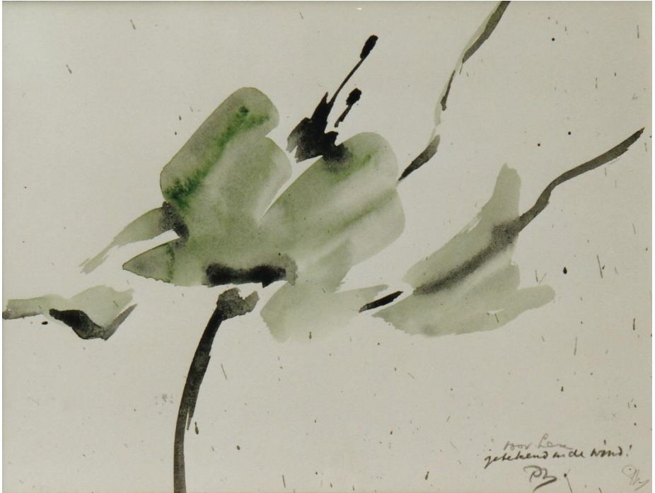
Pieter Wieggersma, "getekend in de wind"

De mensen hebben jou nodig om gezien te kunnen worden.